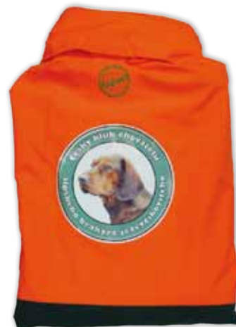
Bunda INTER FORST - 2200,- Kč