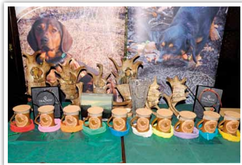
MKHZ o pohár G. Kořínka XII. ročník - Stupava 25. - 27.11.2016