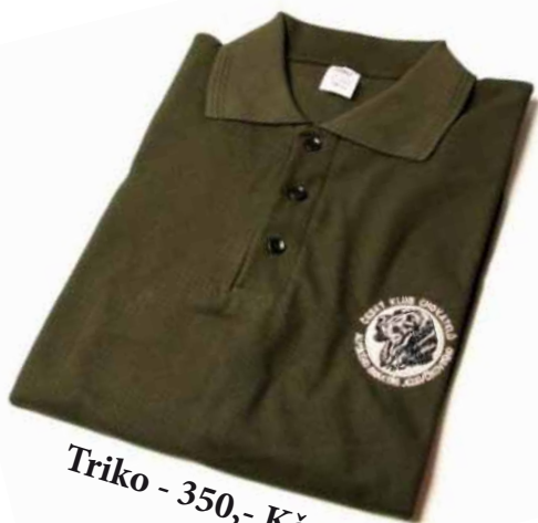
Triko - 350,- Kč