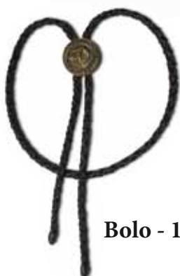
Bolo - 150,- Kč